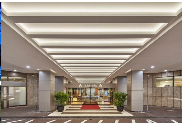
Hotel Nikko, Einfahrt